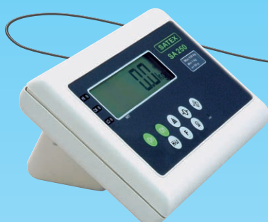
Indicator SA 250, tafelmiddel