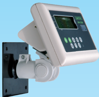
Indicator met wand console (optie)