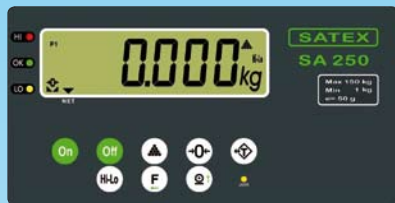
Display front met waterdichte druktoets-schakelaars