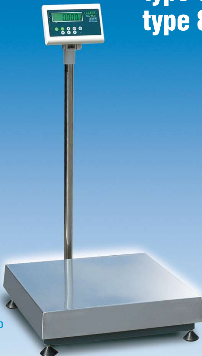
Type 66 SA 250